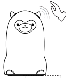
內置LED燈 充電指示燈