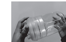
圖2：再將透明上圍逆時針旋轉取下。